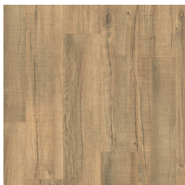
LMT 196 Eiche antik