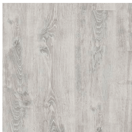
LMT 123 Eiche weiß