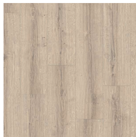
LMT 183 Eiche hell