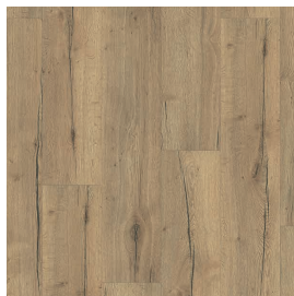
LMT 159 Eiche rustic