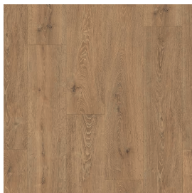
LMT 122 Eiche natur