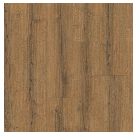
LMT 184 Eiche braun